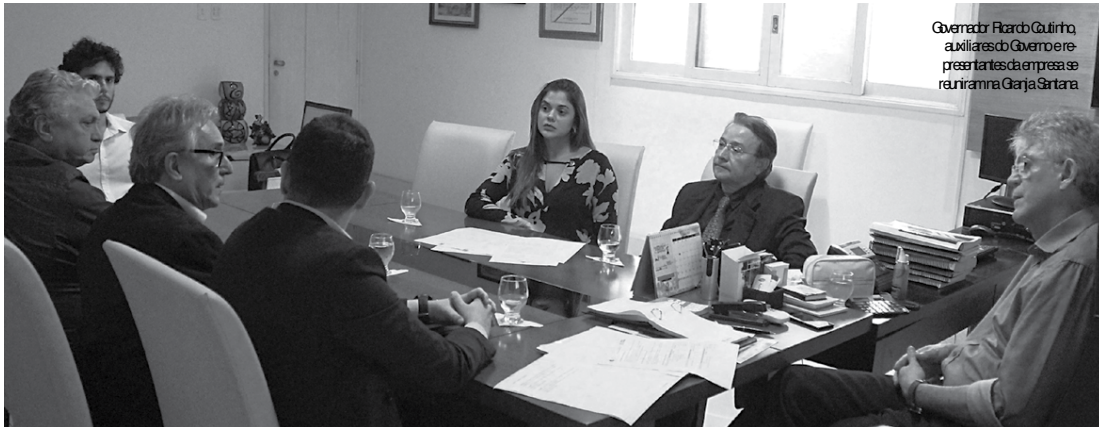
Governador Ricardo Coutinho, auxiliado pelo Governador eleito, reuniu representantes da empresa Garja Santana.