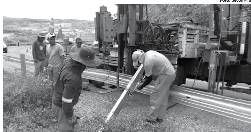
Mais 4.080 metros de defensas metálicas estão sendo implantados em trechos com alto índice de acidentes